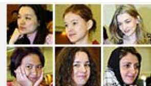
世界美女棋手亮相济南[组图]

从那时到现在，这种病毒共爆发过6次。最严重的一次是1998年到2000年间在刚果爆发的马尔堡病毒，当时共有149人受到感染，死亡123人。大多数受感染者都是金矿的矿工。（王娟 张华念）